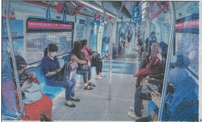
PELAKSANAAN EPCB menampun kecenderungan wanita berhenti kerja selepas bersalin. – GAMBAR HIASAN